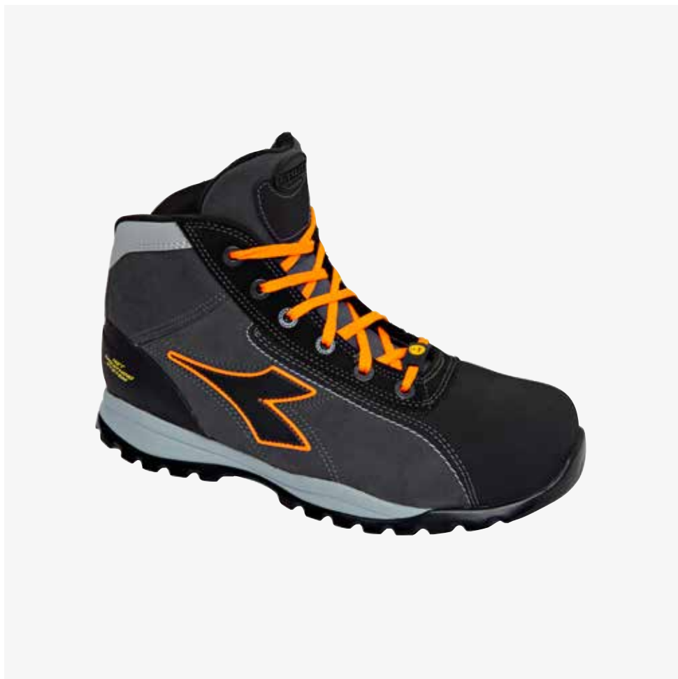
col.C8321 asphalt/orange fluo

Calzatura di sicurezza mid cut S3 in pelle Perwanger antigraffio, idrorepellente e traspirante con sistema di traspirazione Net Breathing System by Geox. Protezione della punta. Puntale in alluminio 200J. Calzata 11. Fodera 3D a camino per maggiore traspirazione ed antiscalzante interno sul retro. Inserto antiperforazione K SOLE BREATHABLE. Plantare estraibile traspirante con carboni attivi. ESD.