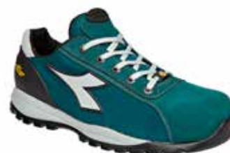
col.70093 octane green

Calzado de seguridad bajo S1P de piel Perwanger anti-arañazos, repelente al agua y transpirable y de tejido de red con sistema de transpiración Net Breathing System de Geox. Puntera de aluminio 200J. Horma 11. Forro 3D efecto chimenea para una mayor transpiración, anti-descalzador interior en la parte trasera. Aplicación anti-perforación K SOLE BREATHABLE. Plantilla amovible transpirable con carbones activos. ESD.