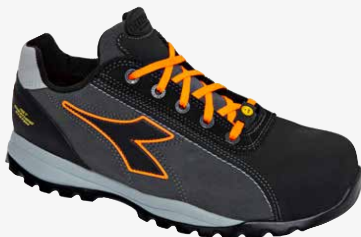
col.C8321 asphalt/orange fluo