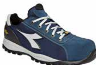
col.60014 blue cosmos