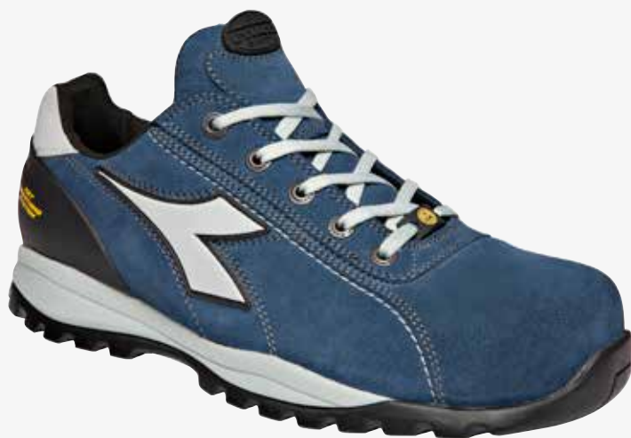
col.60014 blue cosmos