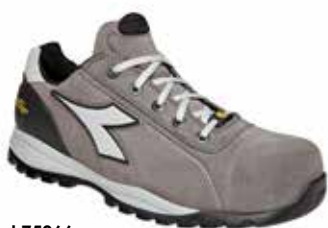
col.75066 wind grey

Calzatura di sicurezza bassa S3 in pelle Perwanger antigraffio, idrorepellente e traspirante con sistema di traspirazione Net Breathing System by Geox. Puntale in alluminio 200J. Calzata 11. Fodera 3D a camino per maggiore traspirazione ed antiscaldante interno sul retro. Inserto antiperforazione K SOLE BREATHABLE. Plantare estraibile traspirante con carboni attivi. ESD.