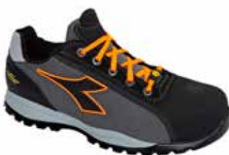
col.C8321 asphalt/orange fluo

Calzado de seguridad bajo S1P de piel Perwanger anti-arañazos, repelente al agua y transpirable y de tejido de red con sistema de transpiración Net Breathing System de Geox. Protección de la puntera. Puntera de aluminio 200J. Horma 11. Forro 3D efecto chimenea para una mayor transpiración, anti-descalzador interior en la parte trasera. Aplicación anti-perforación K SOLE BREATHABLE. Plantilla amovible transpirable con carbonos activos. ESD.