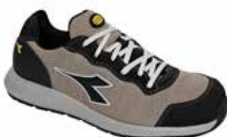
col.C8720 moon rock grey/grey

Calzado de seguridad bajo S3 en tejido de poliéster hidrófugo. Mass Damper Technology, puntera de aluminio 200J. Tallaje 11. Forro Air Mesh, K SOLE, film de TPU. Plantilla extraíble de espuma de poliuretano y carbones activos, talonera de TPU.