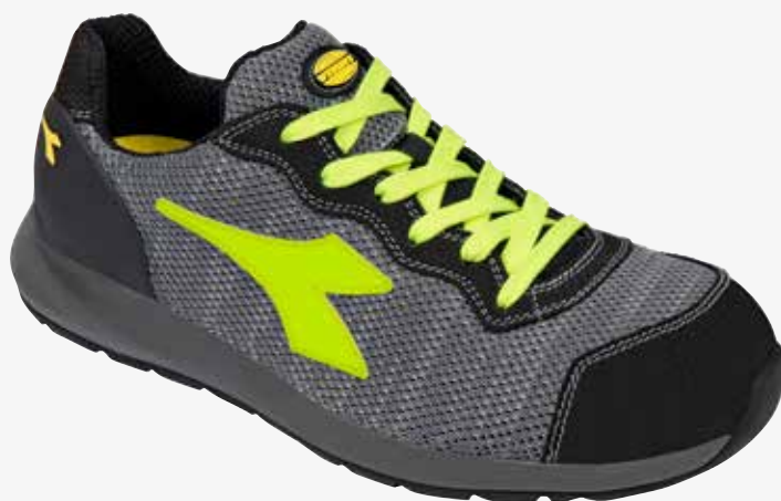
col.75070 steel grey