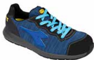
col.60045 persian blue