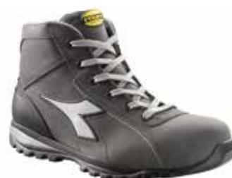
col.75063 shadow grey

Calzatura di sicurezza mid-cut S3 in Nubuck Silk, idrorepellente. Puntale in alluminio 200J. Calzata 10. Fodera Air Mesh. Plantare estraibile in EVA perforata, con inserto shock absorber. Inserto anti-perforazione K SOLE. Protezione del tallone in TPU.