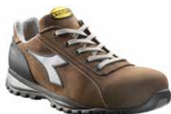
col.30008 dark brown