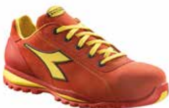
col.45041 dark red