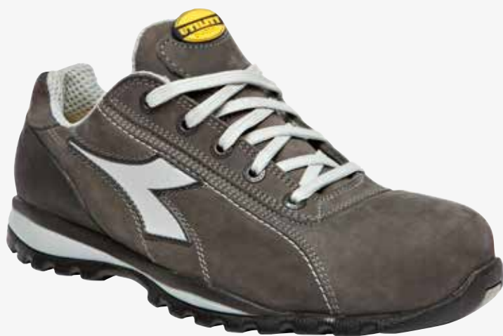
col.75063 shadow grey