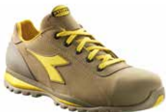
col.75029 moon rock grey