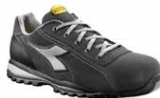
col.75063 shadow grey