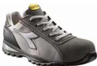
col.C4872 shadow grey/aluminium