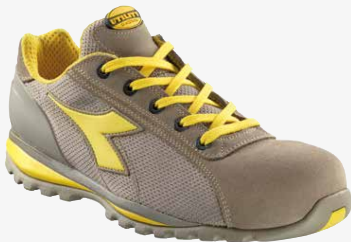
col.75029 moon rock grey