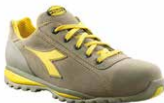
col.75029 moon rock grey

Calzado bajo S1P de becerro ante, puntera de aluminio 200J. Horma 10. Forro Air Mesh. Plantilla amovible perforada de EVA con amortiguador de impactos. Aplicación anti-perforación K SOLE. Protección del talón de TPU.