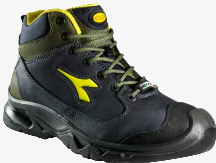
col.8C3585 navy/green conifer