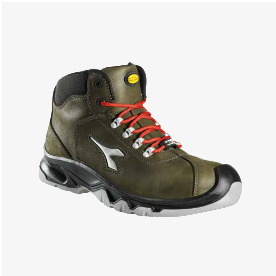
col.70434 green rage