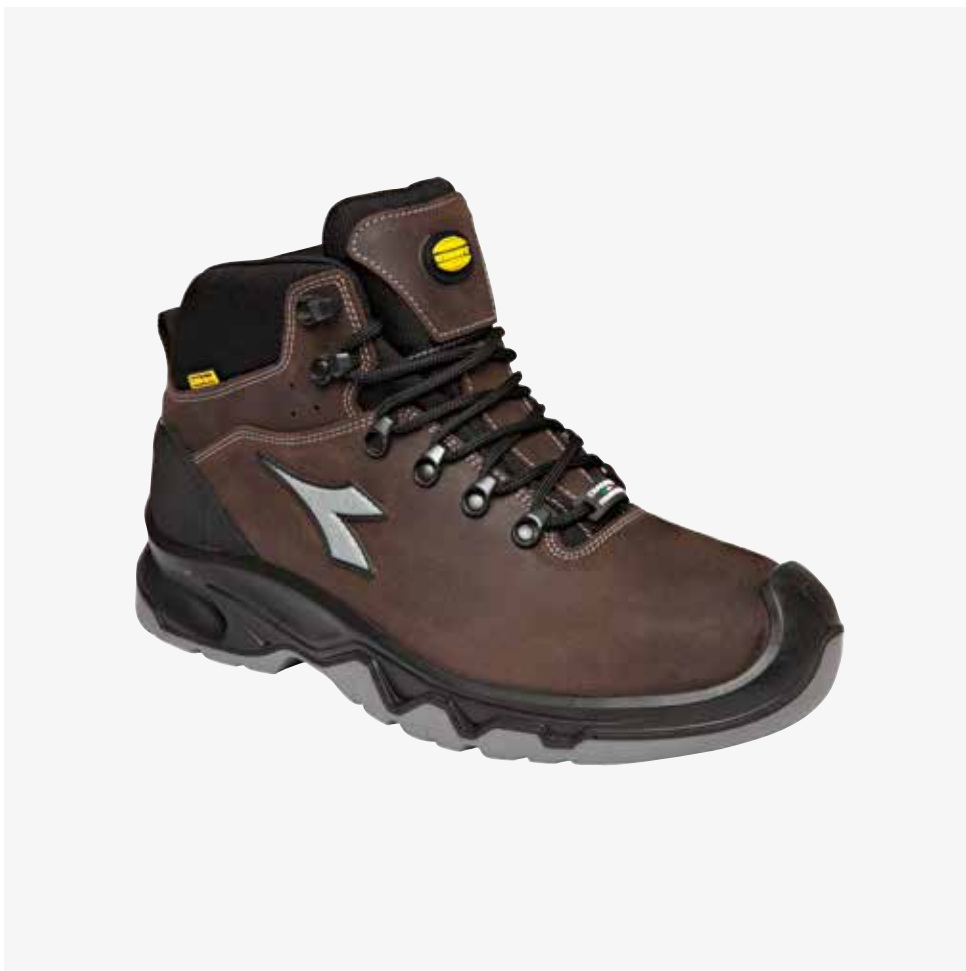
col.30040 brown land

Calzatura mid-cut S3 WR in pelle Perwanger con membrana waterproof DIATEX. Puntale in acciaio 200J. Calzata 10, K SOLE, plantare estraibile termoformato in EVA ed inserto rifrangente.