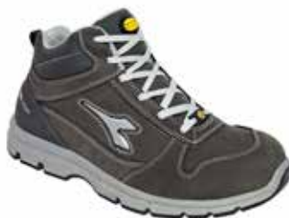
col.75068 castle rock