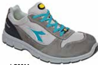
col.C8311 castle rock/scuba blue

Calzatura di sicurezza bassa S1P in crosta e tessuto rete. Punta in acciaio 200J. Calzata 10. K SOLE, fodera in Air Mesh, plantare estraibile traspirante con carboni attivi. ESD.