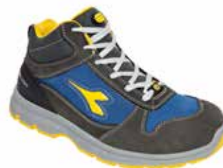
col.C4906 castle rock/insignia blue

Calzatura di sicurezza mid-cut S3 in Nubuck Pull Up idrorepellente, puntale in acciaio 200J. Calzata 10. K SOLE, fodera in Air Mesh, plantare estraibile traspirante con carboni attivi. ESD.