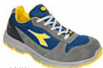
col.C4906 castle rock/insignia blue