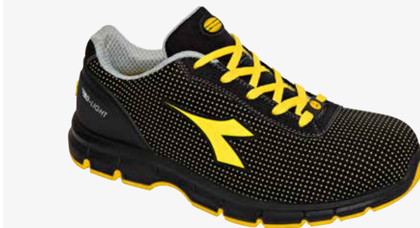
col.C0401 black/yellow crows

Calzatura di sicurezza bassa S3 in ATOM idrorepellente. Puntale in acciaio 200J. Calzata 10. K SOLE, fodera in Air Mesh, plantare estraibile traspirante con carboni attivi. ESD.