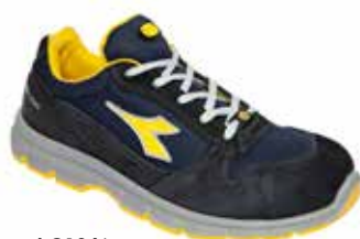
col.C1246 dark navy/dark navy