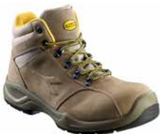
col.30050 dark brown

Calzatura di sicurezza mid-cut S3 in Nubuck pull-up idrorepellente. Puntale Multilayer 200J. Calzata 11. Fodera air mesh, K SOLE, plantare estraibile in EVA.