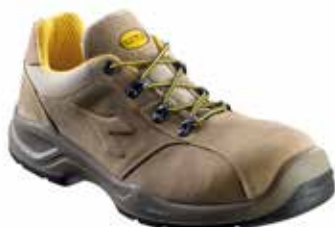
col.30050 dark brown