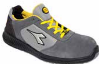
col.75068 castle rock