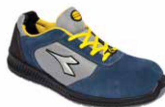
col.60078 blue atlantic

Calzatura di sicurezza bassa S1P in vitello scamosciato e nylon. Puntale Multilayer 200J. Calzata 11. K-SOLE, plantare estraibile in EVA. Metal free. ESD.