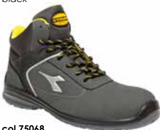
col.75068 castle rock

Calzatura di sicurezza mid-cut S3 in Action Nubuck idrorepellente, nylon e PU. Puntale multilayer 200J. Calzata 11. K SOLE, plantare estraibile in poliuretano shock absorber. Metal free.