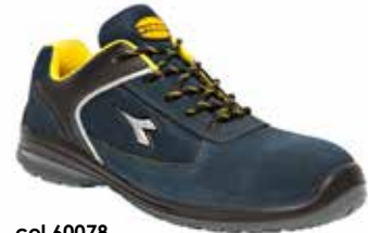
col.60078 blue atlantic

Calzatura di sicurezza bassa S1P in vitello scamosciato, nylon e PU. Puntale multilayer 200J. Calzata 11. K SOLE, plantare estraibile in poliuretano con absorber. Metal free.