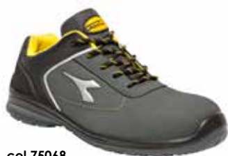
col.75068 castle rock

Calzatura di sicurezza bassa S3 in Action Nubuck idrorepellente, nylon e PU. Puntale multilayer 200J. Calzata 11. K SOLE, plantare estraibile in poliuretano shock absorber. Metal free.