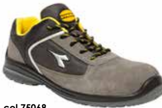
col.75068 castle rock